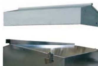
Cubierta de protección frente a la intemperie Con anclajes para cierre de seguridad

*Accesorio opcional que facilita el llenado del depósito con boca de carga tipo "Camsa".