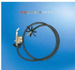
Kit de aspiración