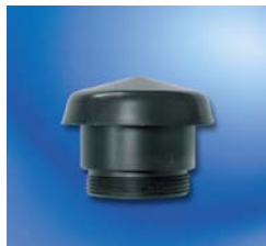
Seta de aireación