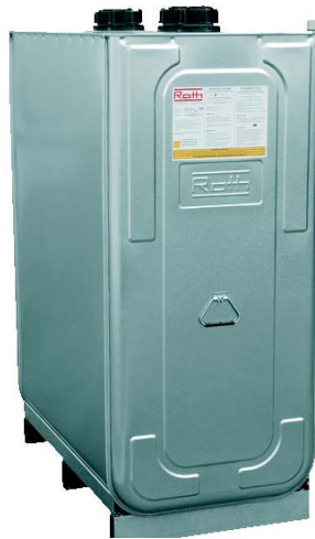
DEPOSITO DUO SYSTEM

No requiere la construcción de un cubeto de obra para su instalación ya que dispone de un cubeto estanco de acero galvanizado.